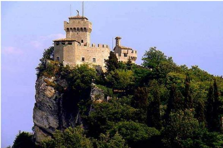
Замок в Сан-Марино