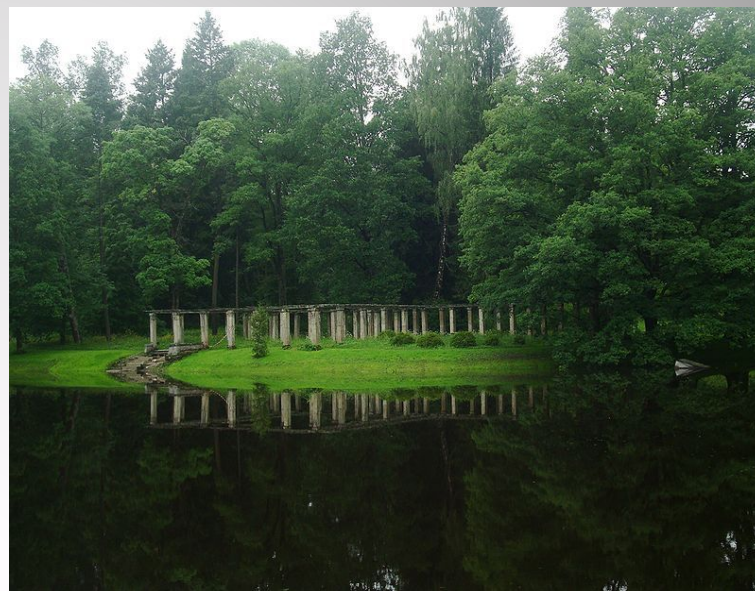
Пергола у Китайского дворца