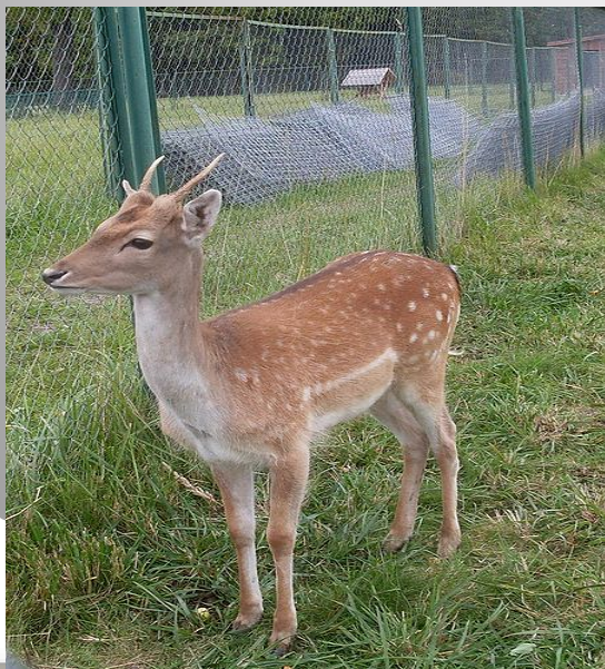
Лань у Кавалерского корпуса