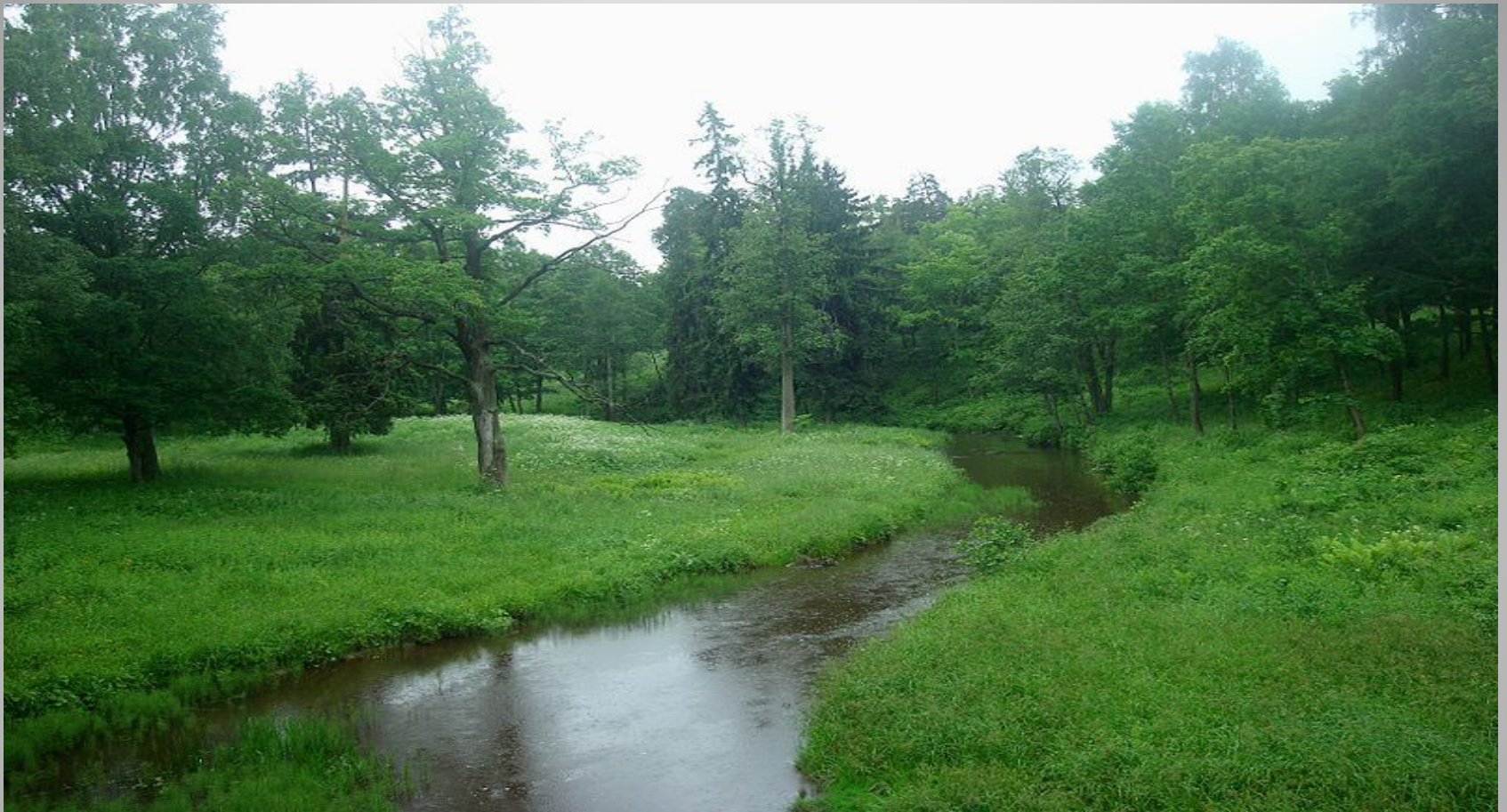
Долина реки Карасты