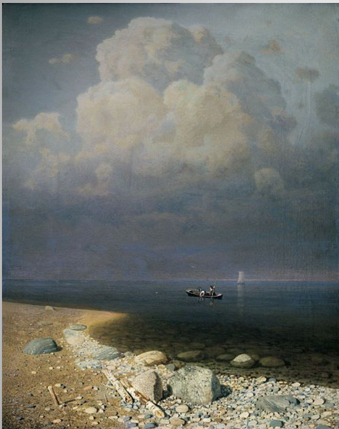
А. И. Куинджи. Ладожское озеро. 1873 г.