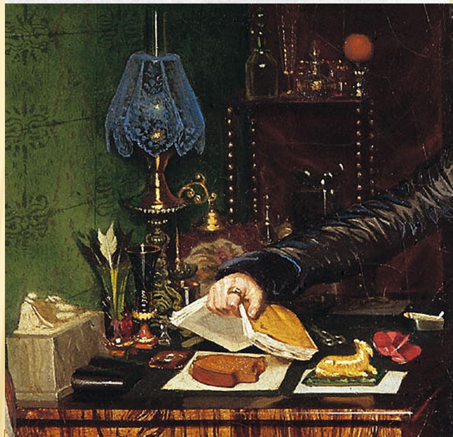
Федотов Павел Андреевич «Завтрак аристократа»