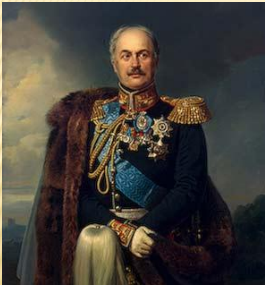
Павел Дмитриевич КИСЕЛЕВ, министр гос. имущества