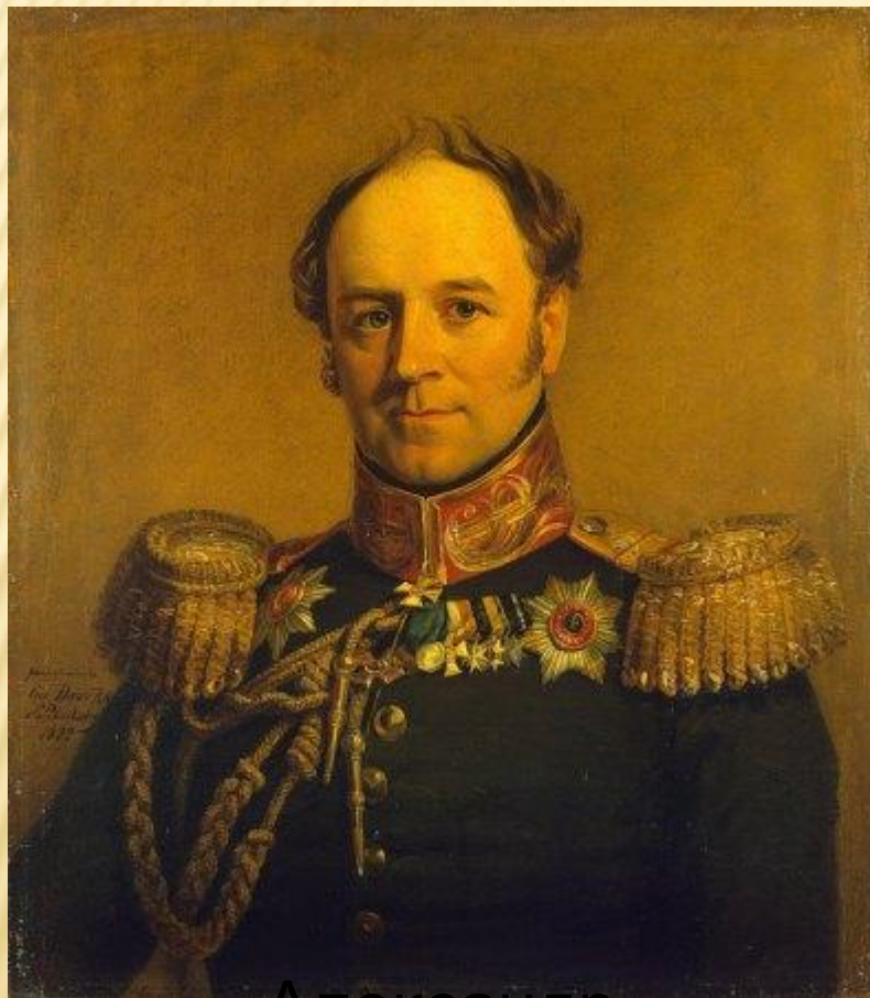
Александр Христофорович Бенкендорф, граф

«... Государь избрал меня для образования высшей полиции, которая покровительствовала бы утесненным и наблюдала за злоумышлениями людей»