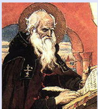
«Нестор-летописец». Эскиз В. М. Васнецова для Владимирского собора в Киеве. Акварель, гуашь, золото.

«Прибытие Рюрика в Ладугу» В. М. Васнецов. 19 век.