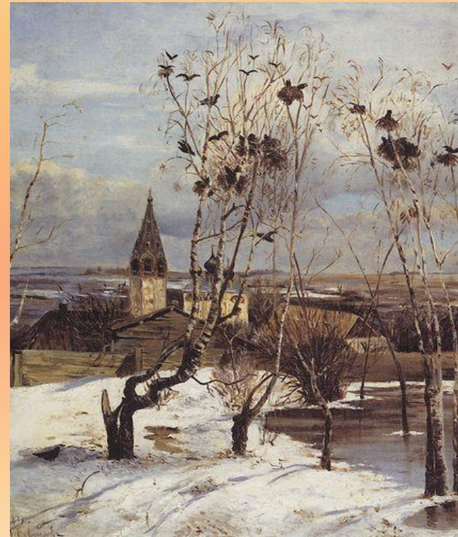
А. Саврасов «Грачи прилетели».