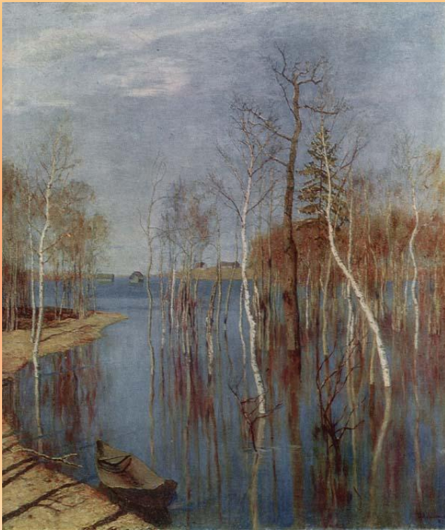
И. Левитан «Весна - большая вода».

Назовите признаки весны на картинках русских художников