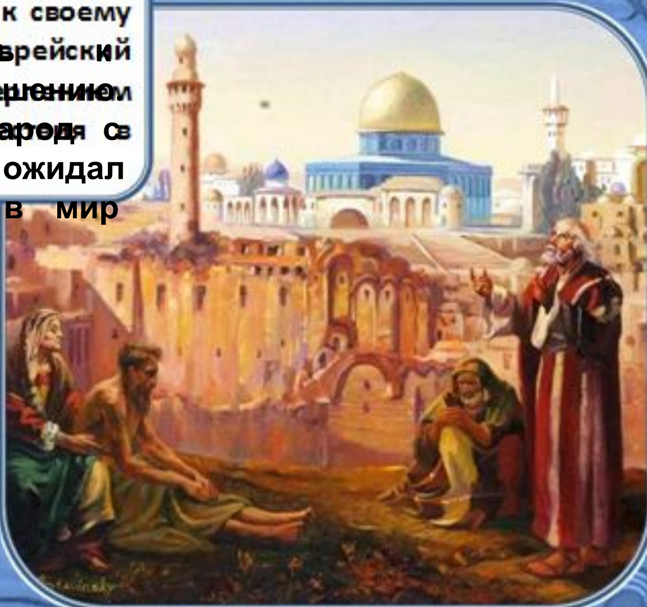
Иерусалим. О. Стаунский Ставинский

Ветхозаветные времена время приближали своему завершению Еврейский народ с нетерпением ожидал пришествия в мир Мессии.