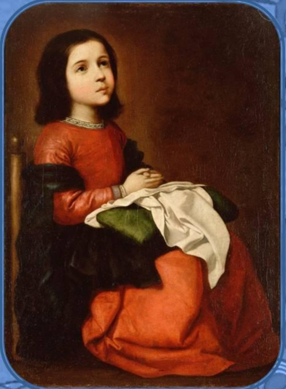
Франсиско де Сурбаран Детство Марии

Там Она вместе с другими девицами обучалась Закону Божью и рукоделию.