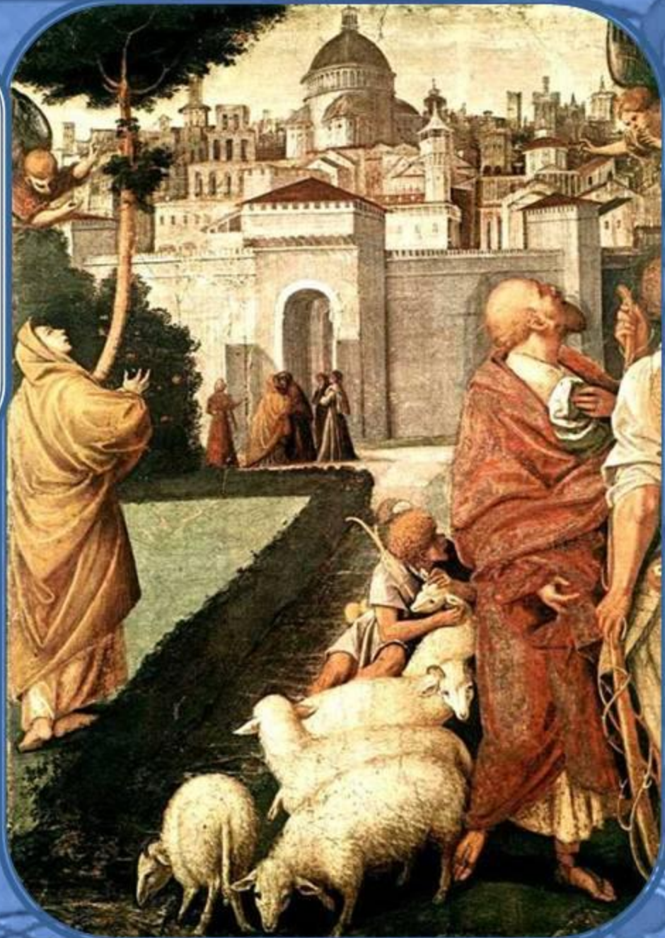
Гауденцио Феррари. Благовещение Иоакиму и Анне

Поэтому, несмотря на свою старость, Иоаким и Анна не переставали просить у Бога, чтобы Он даровал им дитя.