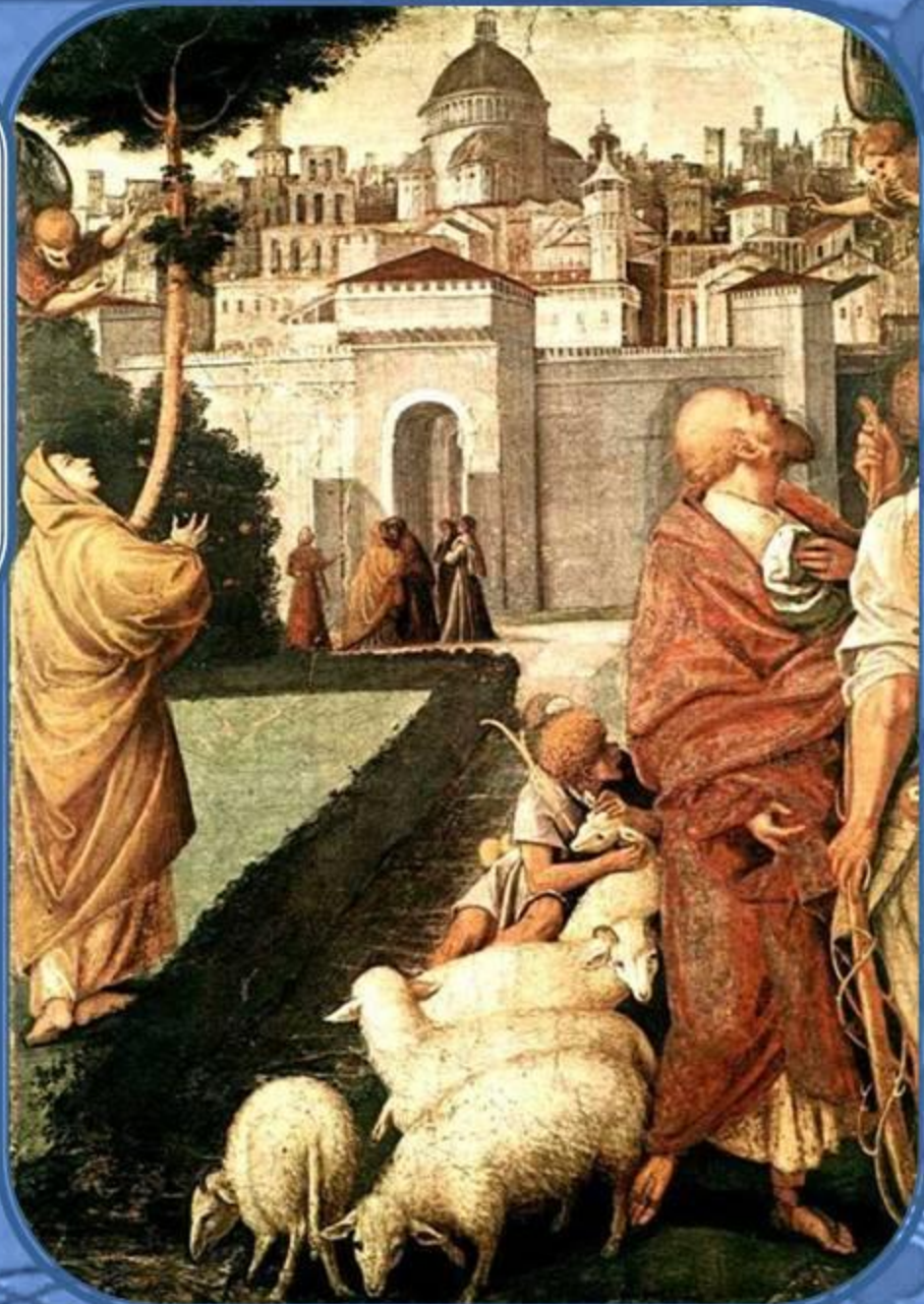
Гауденцио Феррари. Благовещение Иоакиму и Анне

Поэтому, несмотря на свою старость, Иоаким и Анна не переставали просить у Бога, чтобы Он даровал им дитя.