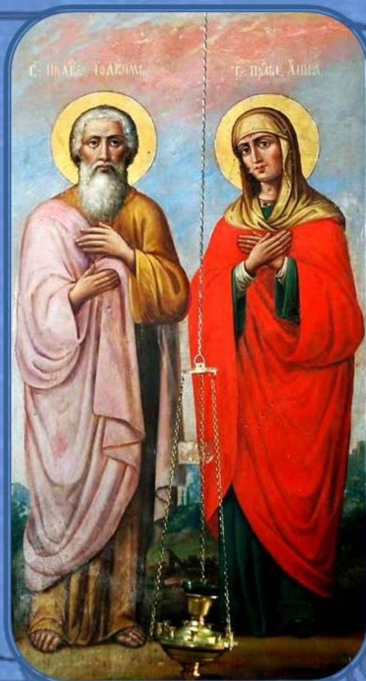
Праведные Иоаким и Анна

Оба они были люди праведные и были известны не своим царским происхождением, а смирением и милосердием.