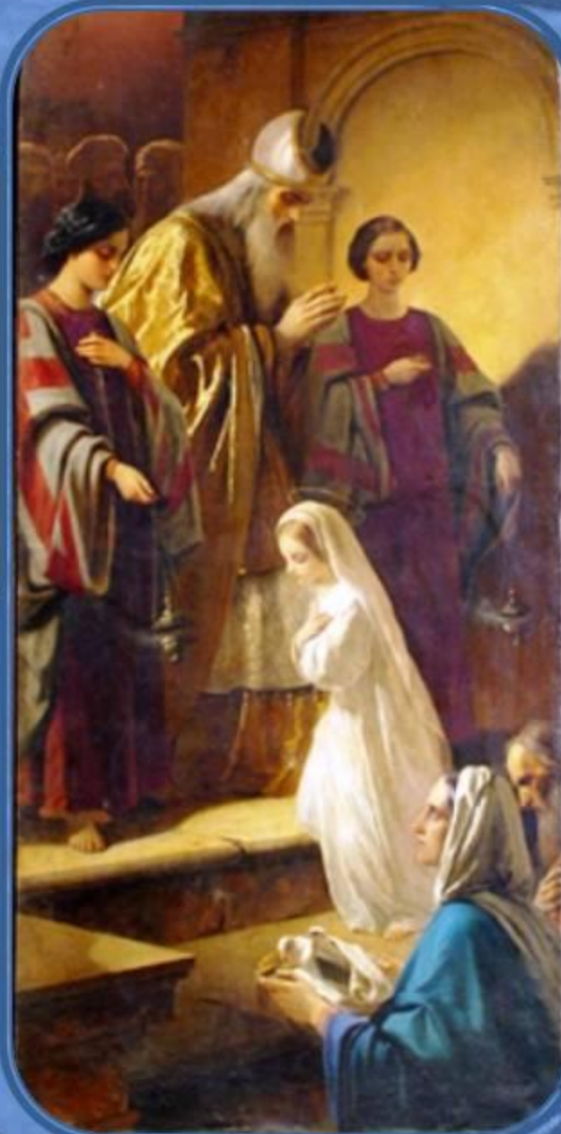
Нефф Т. Введение Богородицы во храм

Они созвали родственников, пригласили сверстниц своей Дочери, одели Ее в лучшие одежды и, сопровождаемые народом, с пением духовных песен, повели Ее в Иерусалимский храм для посвящения Богу.