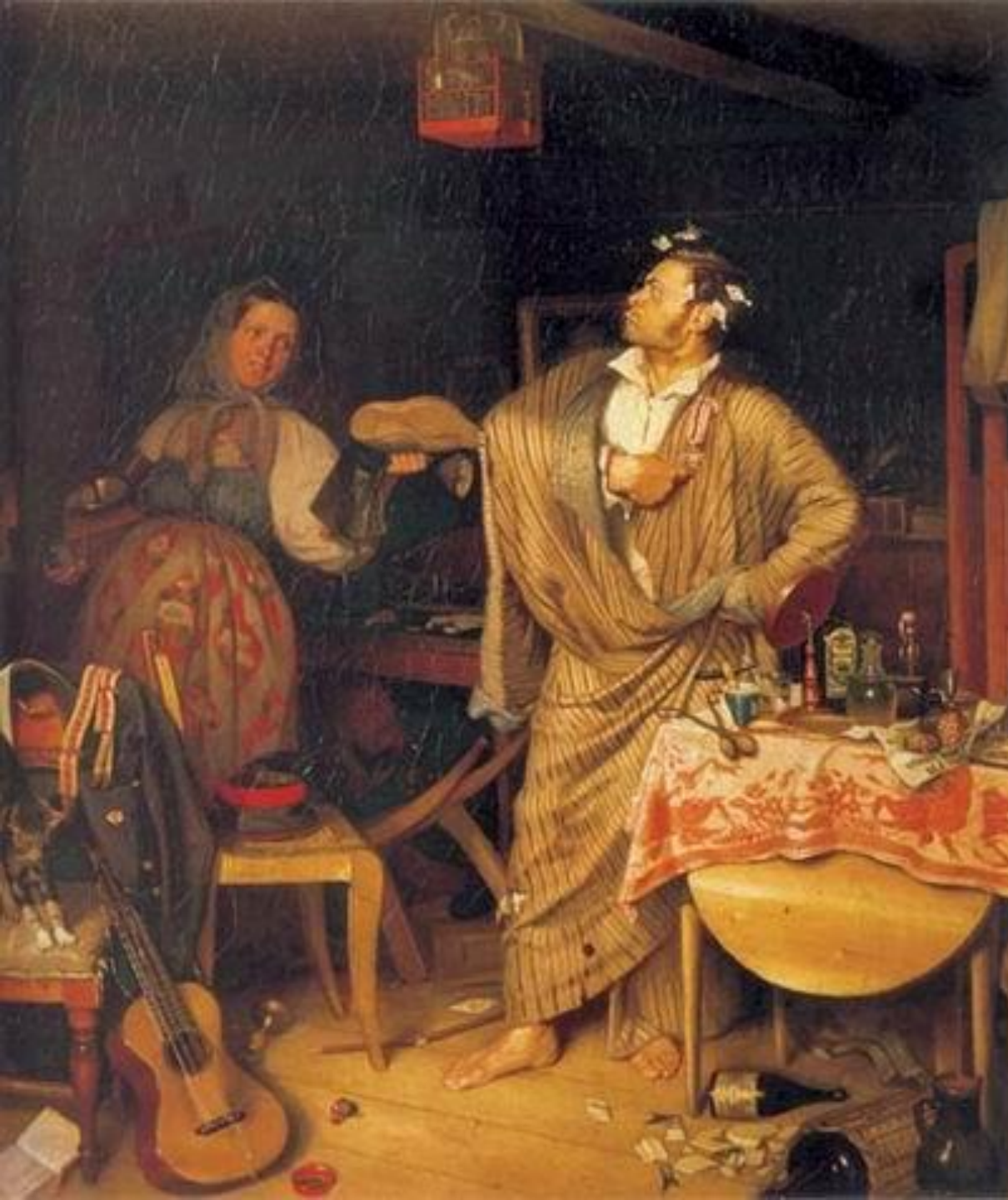
Федотов П.А.: «Свежий кавалер»