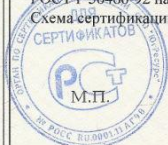
Схема сертификации: 3.

Руководитель органа (заместитель руководителя)