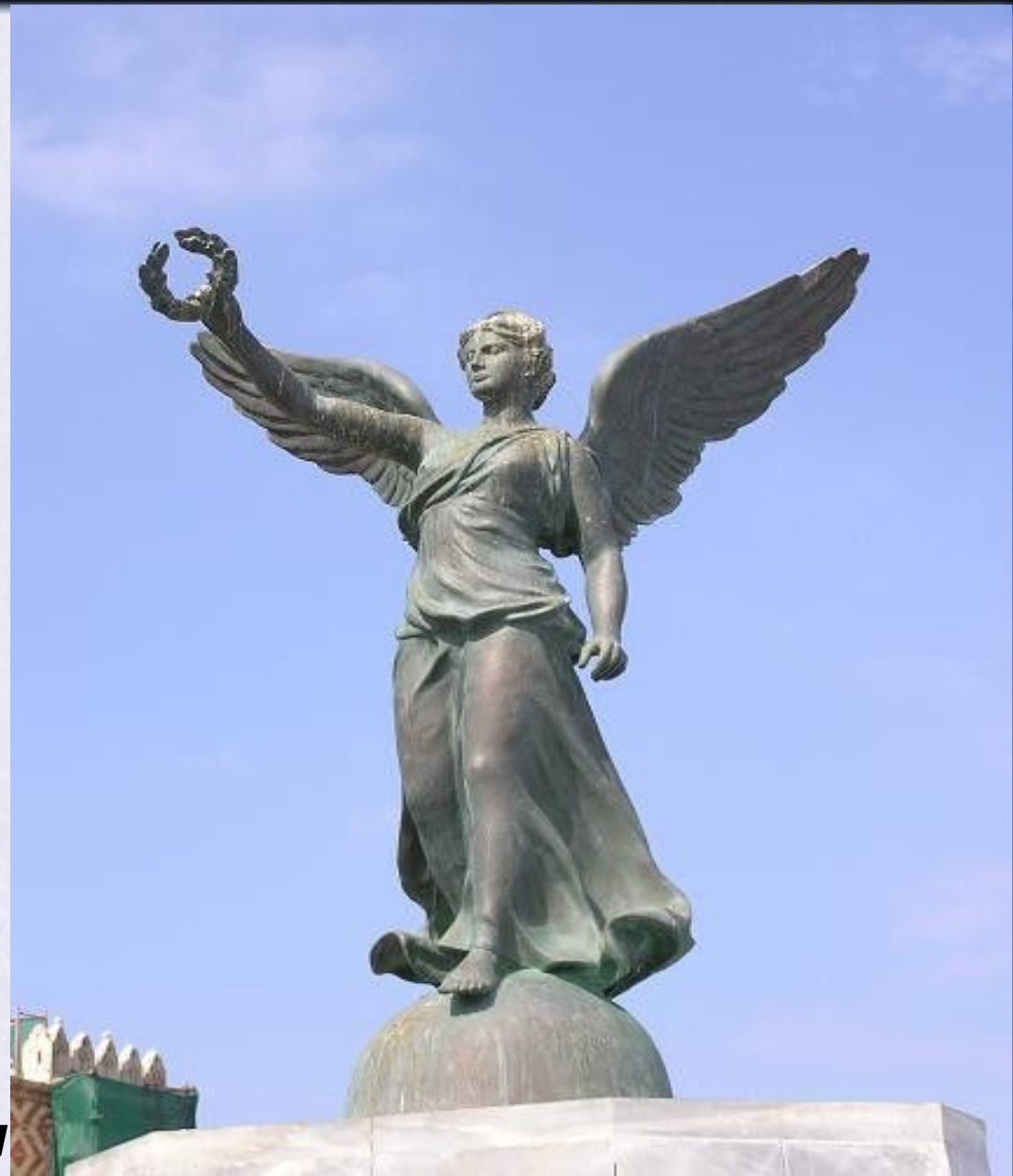
Ника- богиня победы