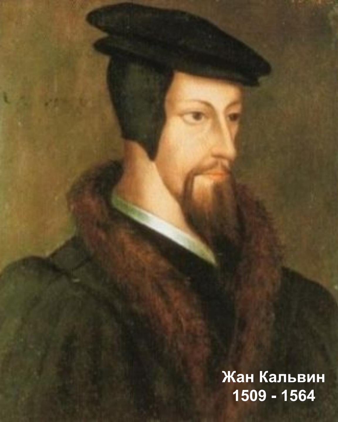
Жан Кальвин 1509 - 1564