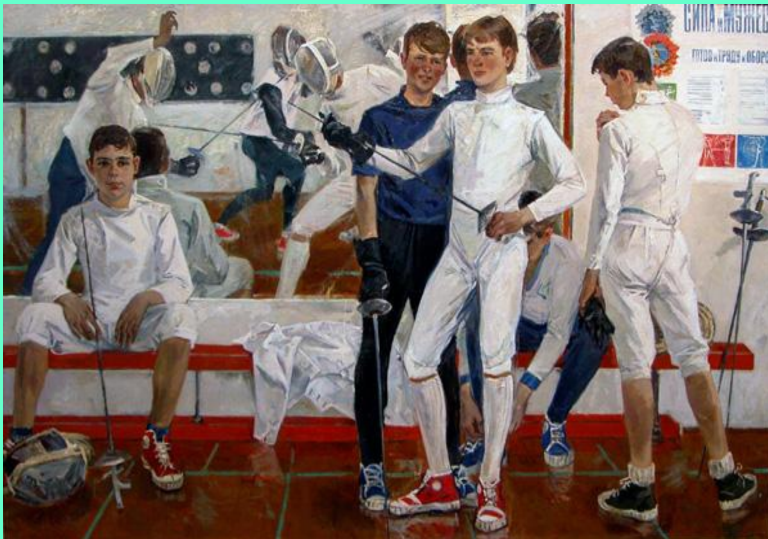
Юные мушкетеры. 1974