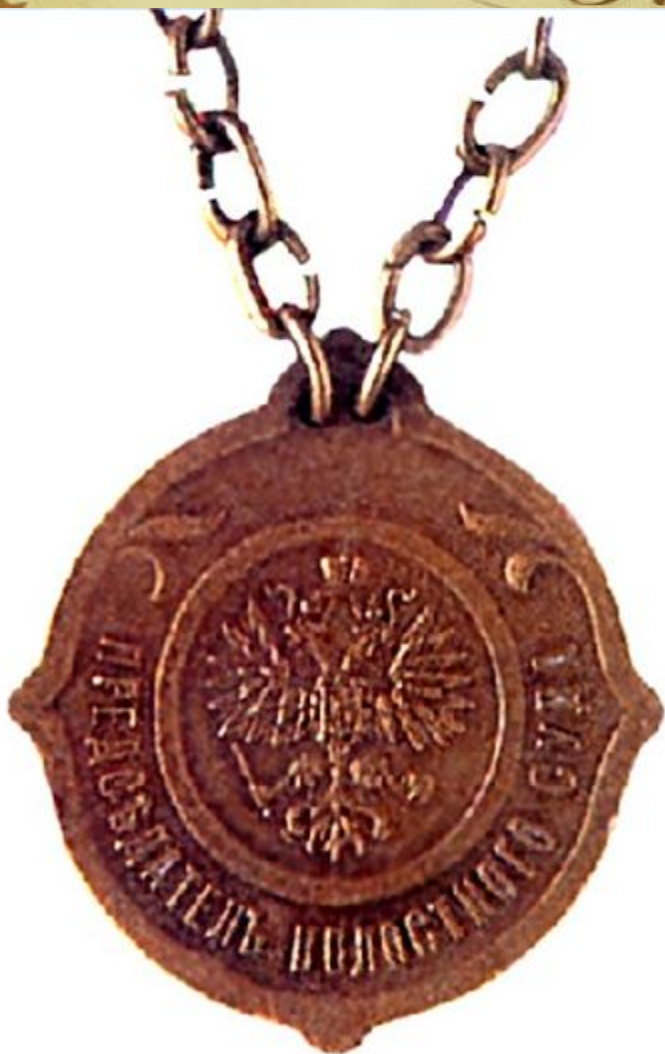
Знак председателя волостного суда.

Наиболее законченной была судебная реформа 1864 года. Ликвидировался прежний суд - сословный и закрытый. Судебный процесс в России стал гласным, публичным и состязательным. Обвинял подсудимого прокурор, а защищал адвокат - присяжный поверенный. Вводилось две системы судебных органов: выборные (мировые судьи) - разбиравшие мелкие уголовные и гражданские дела; назначенные (окружные суды и судебные палаты), занимавшиеся основной массой судебных дел. Вердикт о виновности выносила коллегия выборных присяжных .