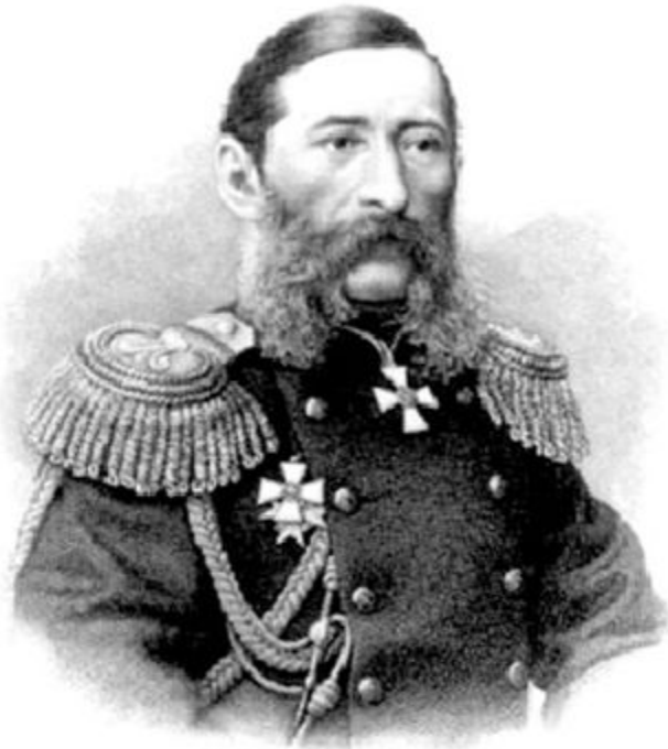
Михаил Тариелович Лорис-Меликов.

Утром 1 марта 1881 года Александр II утвердил программу либеральных мероприятий, получившую название «конституция Лорис-Меликова». Но в жизнь она проведена не была, так как именно в этот день террористы достигли своей цели. В царскую карету Н. Рысаков бросил бомбу, которая не причинила вреда царю, но ранила несколько человек. Император вышел из кареты, а затем стоявший рядом И. Гриневицкий бросил бомбу царю под ноги. Александр II умер через несколько часов.