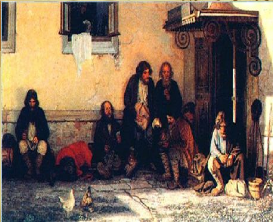
Земство обедает. Художник Г.Г. Мясоедов. 1872 год. Крестьяне в ожидании приема у дверей земской управы.

Отмена крепостного права потребовала проведения целого ряда реформ, изменивших систему государственной власти. В 1864 году была проведена земская реформа , смысл которой заключался в создании органов местного самоуправления. Теперь в губерниях и уездах вводились земства , избираемые жителями на местах. Правом голоса пользовались земельные собственники, крестьянские общины, владельцы промышленных и торговых заведений. В ведение земств поступало содержание школ, больниц, тюрем, благоустройство и снабжение уездов продовольствием.