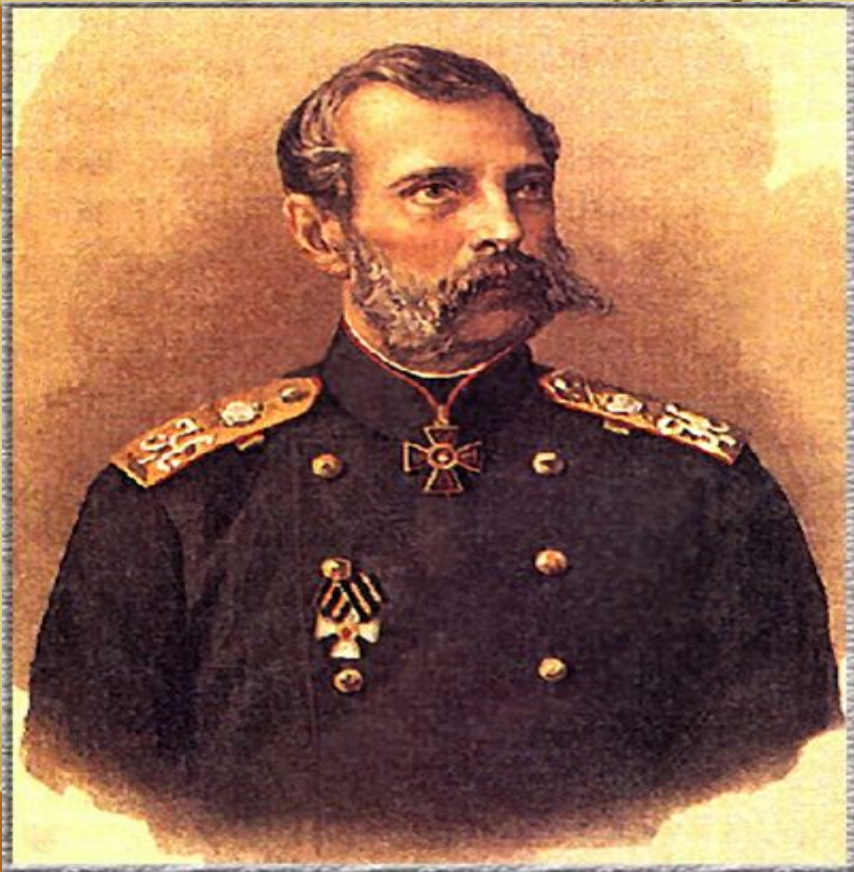
Император Александр II. Художник Н. Борель. Хромофотография 1895 г.

Главным итогом реформ 60-х годов XIX века стало освобождение крестьян от крепостной зависимости. Это открыло для России новый этап развития, страна после 1861 года вступила на путь капитализма.