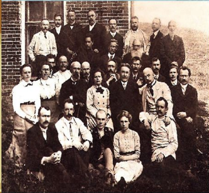
Врачи и служащие Земской больницы в Дмитрове.

В 1870 году была проведена городская реформа. Вводилась новая форма городского самоуправления: распорядительный орган - городская дума , исполнительный орган - городская управа . Избирать и избираться могли только те люди, которые обладали имуществом и платили налоги . Во главе думы и управы стоял городской голова. Дума занималась вопросами просвещения, здравоохранения, благоустройством улиц и площадей, благотворительностью.