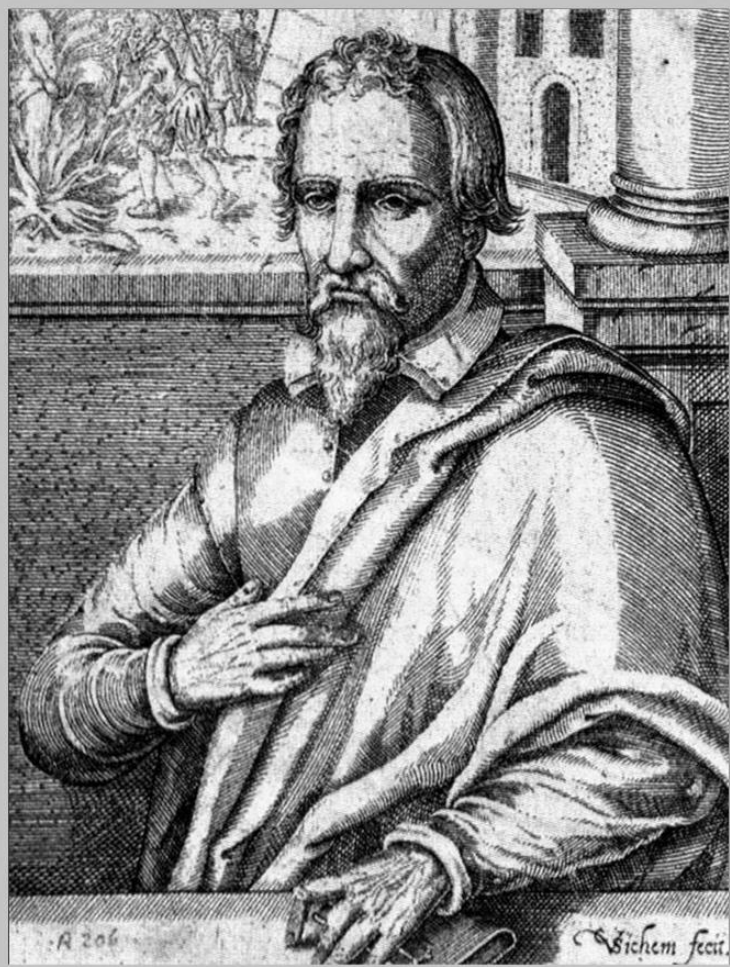
Жан Кальвин. Гравюра 17 в.

В 40-х гг. XV в. начался второй этап Реформации. Его возглавил Жан Кальвин, выдвинувший идею «божественного предопределения». Люди изначально поделены на тех, кто спасется, и тех кто погибнет. Но это заранее неизвестно. Поэтому нужно вести себя как подобает божественным избранникам.