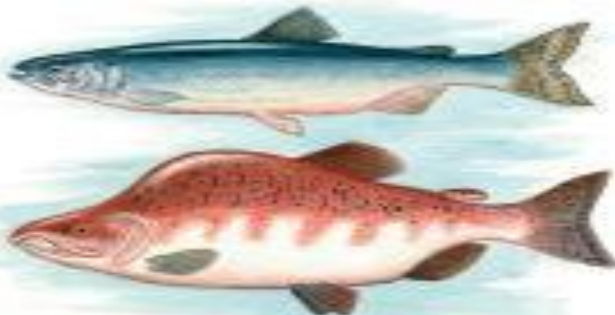
Рис. 123. Горбуша- серебрянка и окраска самца горбуши перед нерестом