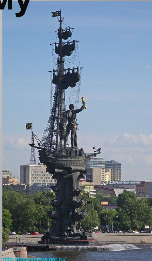
300 -летию российского флота