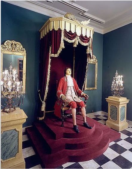
К. Б. Растрелли