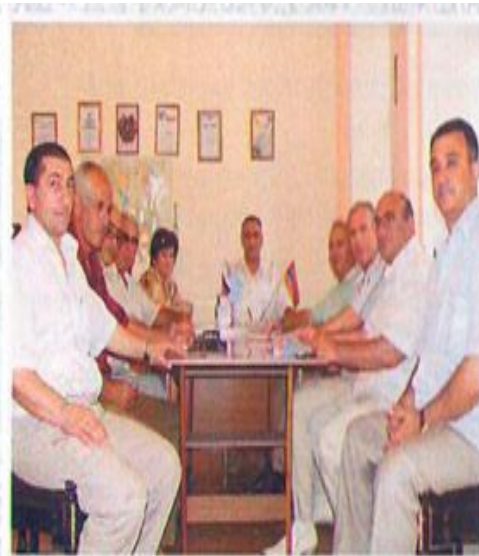
Правление общества армянской культуры "Арев", 2005 год