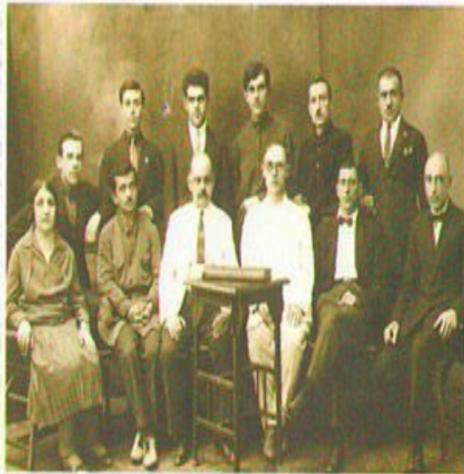
Правление армянского общества в Астрахани. 1927 год

В 1991 г. было создано Астраханское областное общество армянской культуры «Арев» («Солнце»), сосредоточившее свои усилия на возрождении национальной культуры, обычаев и традиций армянского народа. В 1996 г. была зарегистрирована общественная организация «Астраханское областное христианское армяно-григорианское общество».