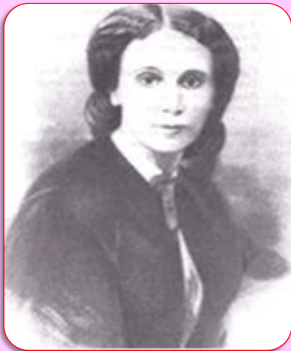
Фотография 1860-е гг.

О, как убийственно мы любим, Как в буйной слепоте страстей Мы то всего вернее губим, Что сердцу нашему милей!