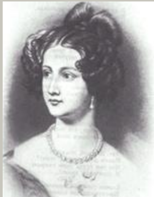
Возлюбленная Ф.И.Тютчева. Портрет работы И. Штиллера 1830-е гг.