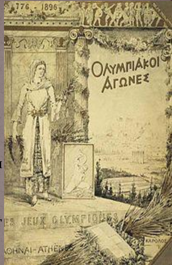
Плакат первых Олимпийских игр