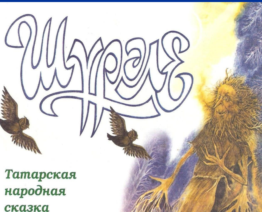
Татарская народная сказка

В устном народном творчестве популярным жанром являлись байты – произведения эпического характера, повествующие об исторических событиях. Ещё развиты песенный и сказочный жанры, пословицы и поговорки, частушки.