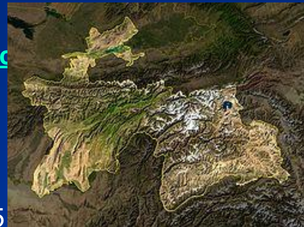
Таджикистана со спутника