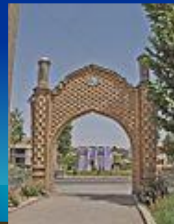
Арка в Истаравшане

Таджикиста́н ( тадж. Тоҷикистон), официально Респуб́лика Таджикиста́н ( тадж. Ҷумҳурии Тоҷикистон ) — государство государство в Центральной Азии , бывшая Таджикская Советская Социалистическая Республика бывшая Таджикская Советская Социалистическая Республика в составе СССР .