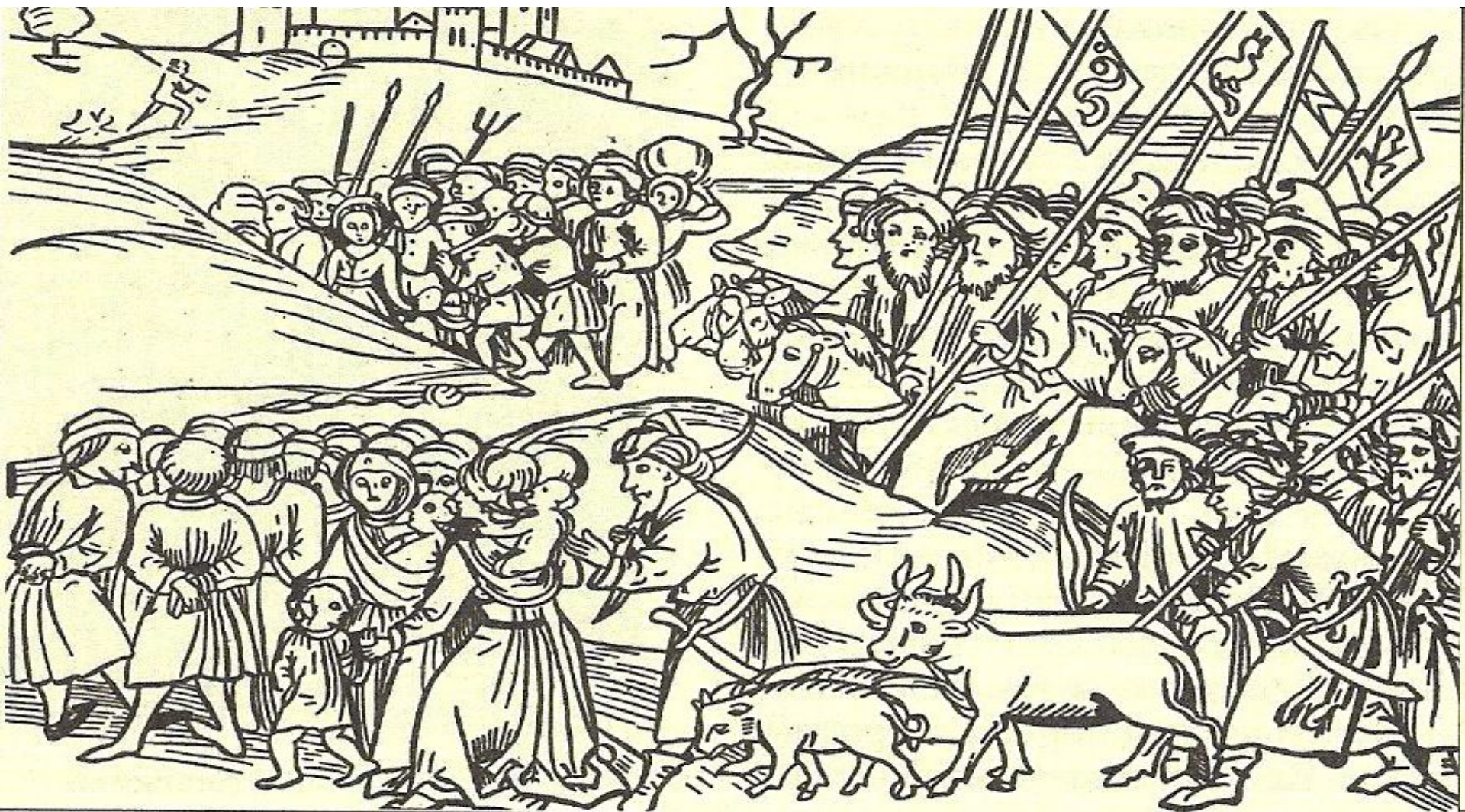
Угон русского полона в Орду. Миниатюра из венгерской хроники XV в.