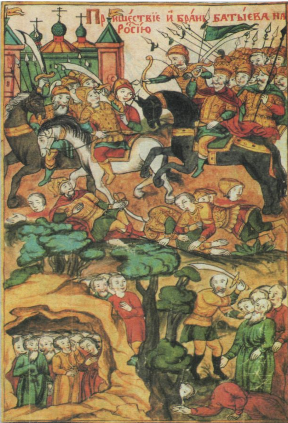
Нашествие хана Батыеа на Русь. Миниатюра XVII в.