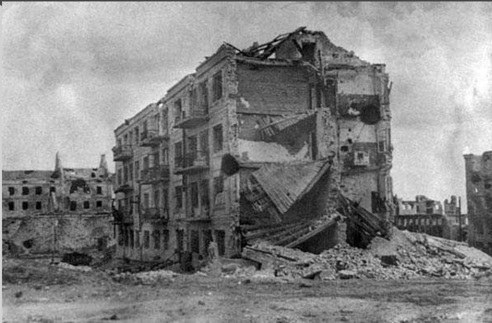
Дом Павлова в Сталинграде