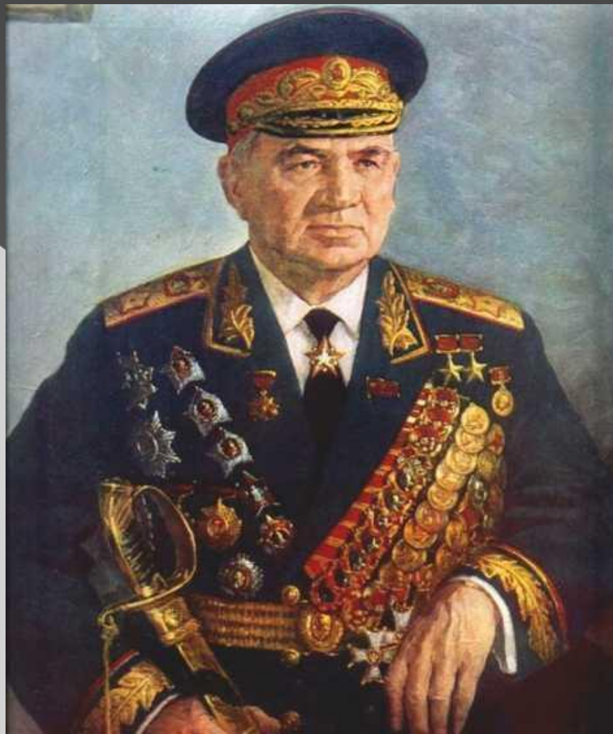
Маршал Советского Союза В.И.Чуйков