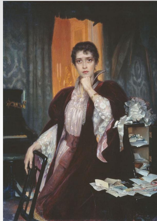
Анна Каренина (по роману Л.Н. Толстого)