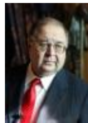
А.Усманов Металлоинвест $ 17,7млн.