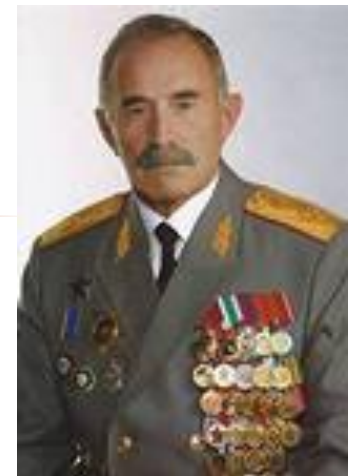
А.Аслаханов – депутат Госдумы от Чечни 2000-2003