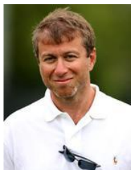
Р.Абрамович Инвестиции $ 13,4млн.