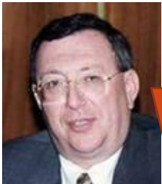
В.А. Гусинский НТВ

Банкротство НТВ, кадровые перестановки в ОРТ