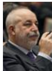
В.Вексельберг Ренова, ТНК ВР $ 13,4млн.