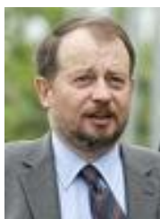
В.Лисин НЛМК $ 24млн.