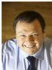
М.Фридман Альфа-Групп $ 15,1 млн.