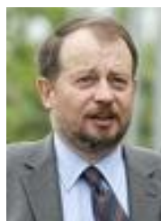
В.Лисин НЛМК $ 24млн.