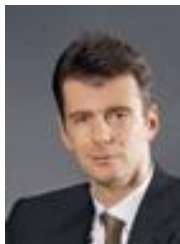
М.Прохоров ОНЭКСИМ $ 18 млн.