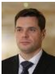
А.Мордашов Северсталь $ 18,5 млн.