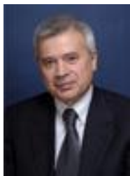
В.Алекперов НК Лукойл $ 13,9млн.