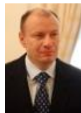
В.Потанин Интеррос $ 17,8 млн.