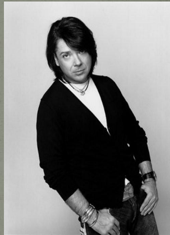
Вячеслав Зайцев Игорь Чапурин Валентин Юдашкин