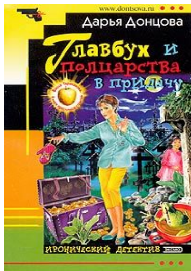
Книга Дарьи Донцовой «Главбух»