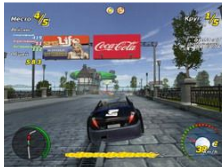
Компьютерная игра «Адреналин», реклама Соса-Сола