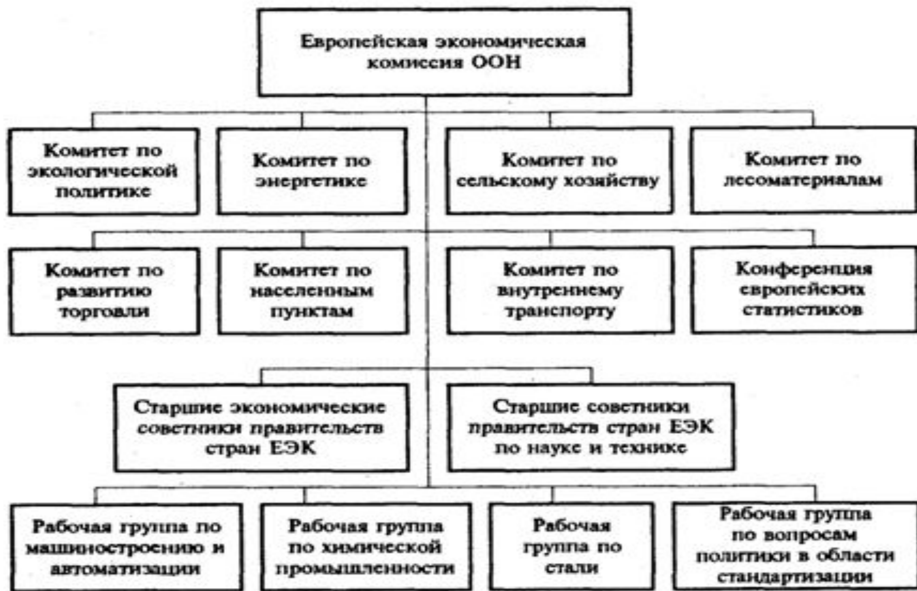
Рис. 10.8. Схема организационно-функциональных аспектов деятельности ЕЭК