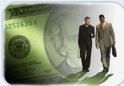
Компании , осуществляющие зарубежные вложения активов