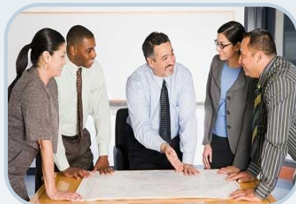
Фирмы, осуществляющие внешнеторговые операции