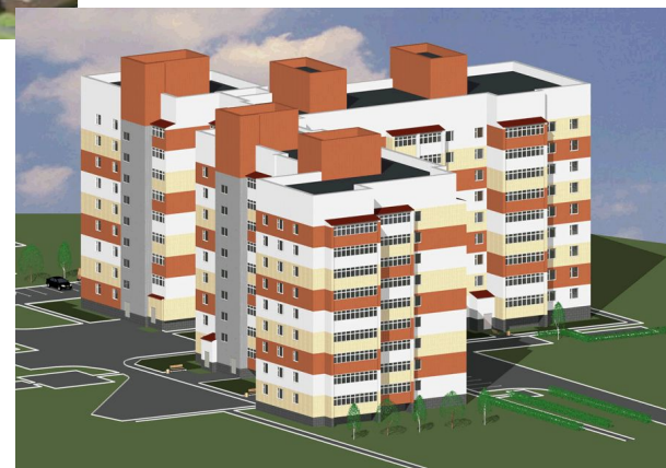
Новые объекты г. Саранска