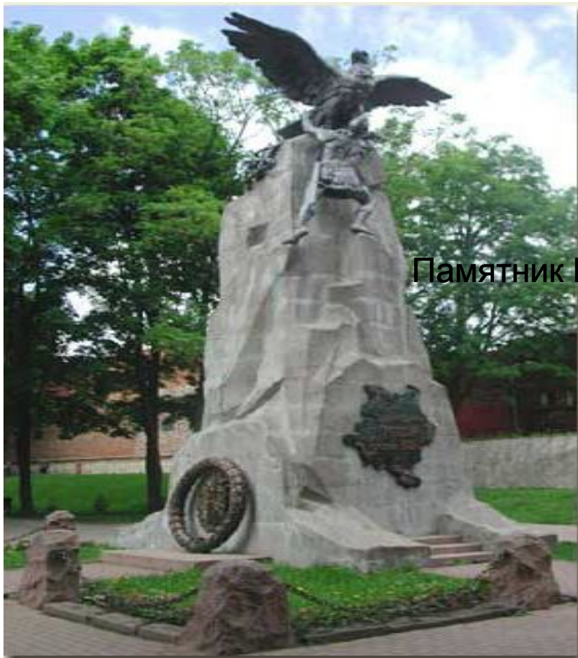
Памятник Героям 1812 г.