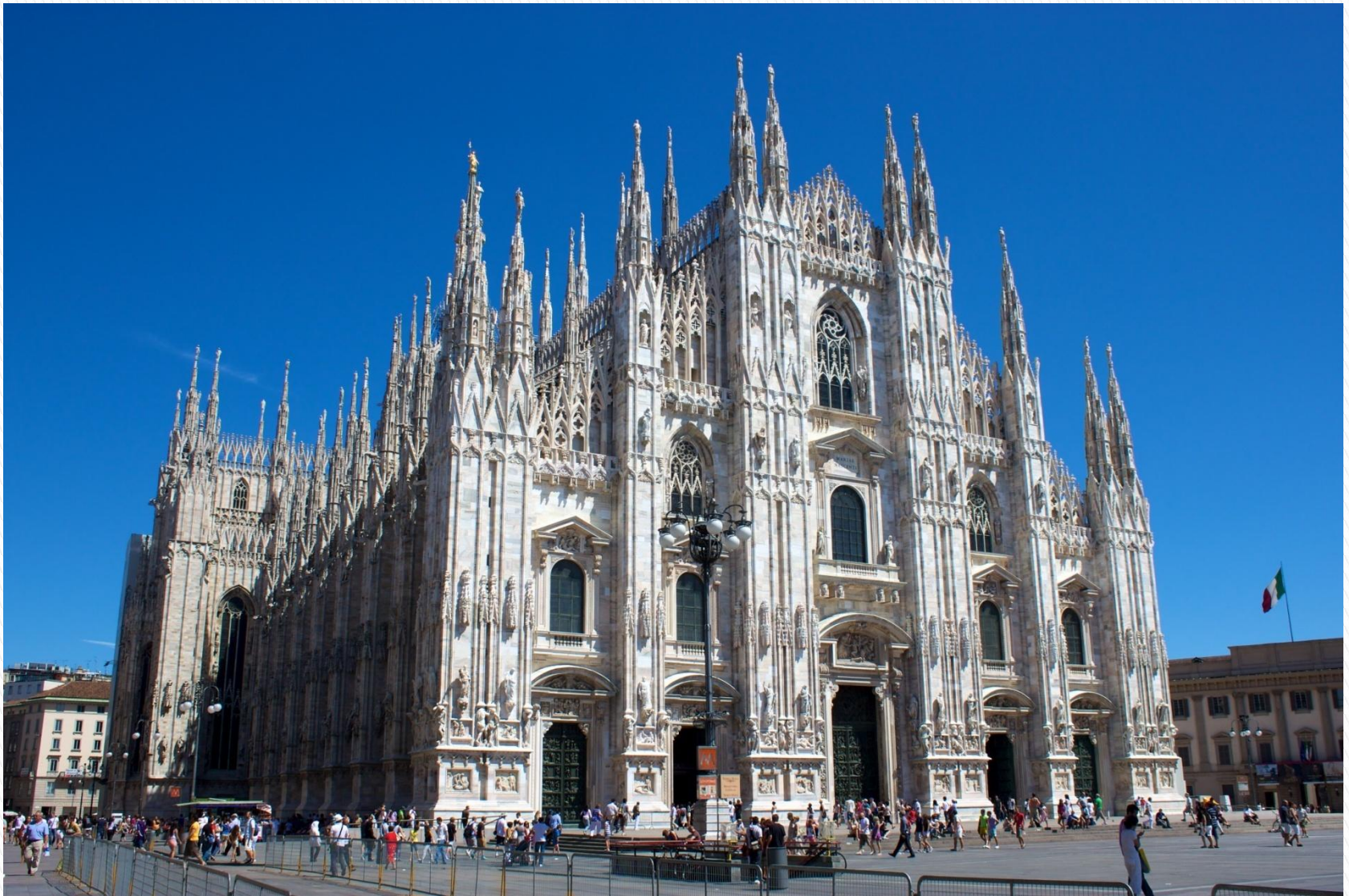
Кафедральный собор, Милан, Италия