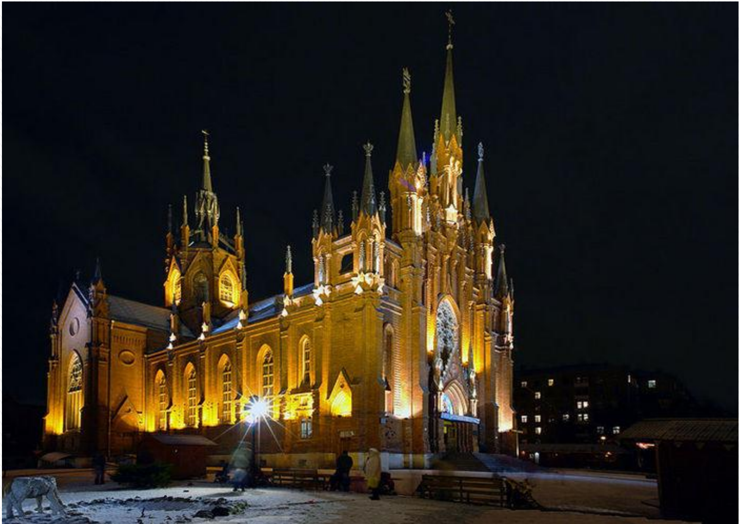
Церковь Непорочного зачатия, Москва, Россия