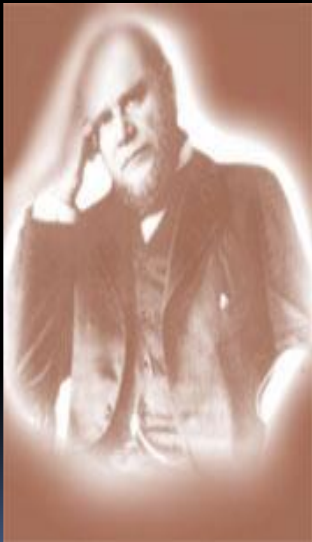
Кони Анатолий Федорович (1844-1927)

Ушедшие в себя эгоисты обыкновенно очень долго живут.