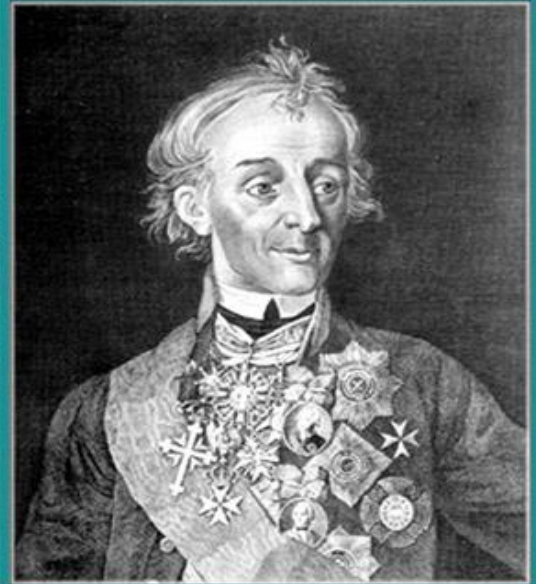
Field Marshall Count Alexander Vasilievich Suvorov Rimniksky