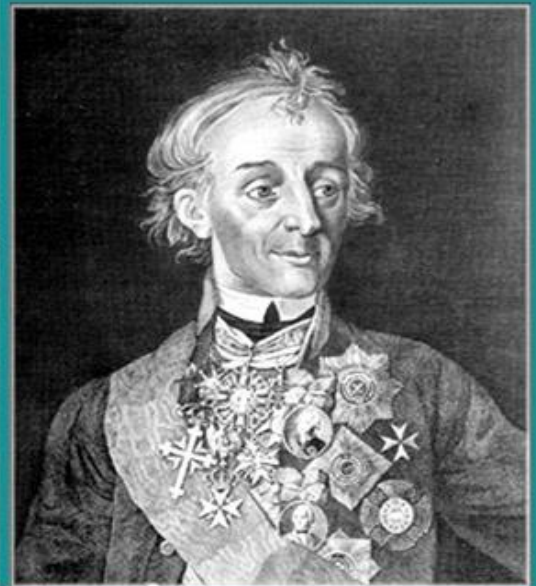
Field Marshall Count Alexander Vasilievich Suvorov Rimniksky