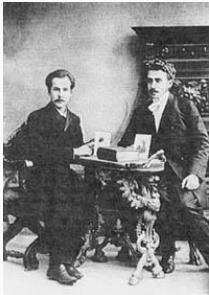
Александр Блок и Андрей Белый

Это и есть то “мгновение слишком яркого света”, о котором Блок писал А. Белому.