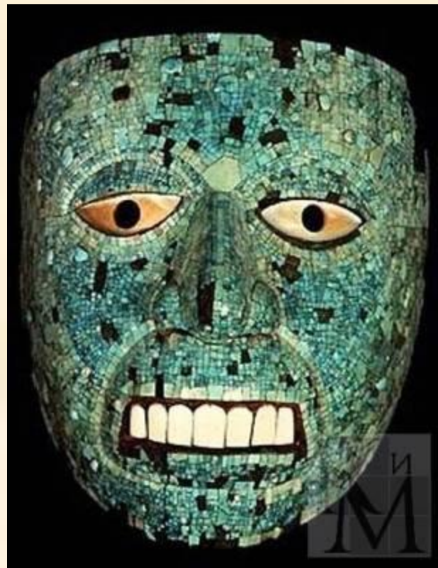
Погребальные маски ацтеков