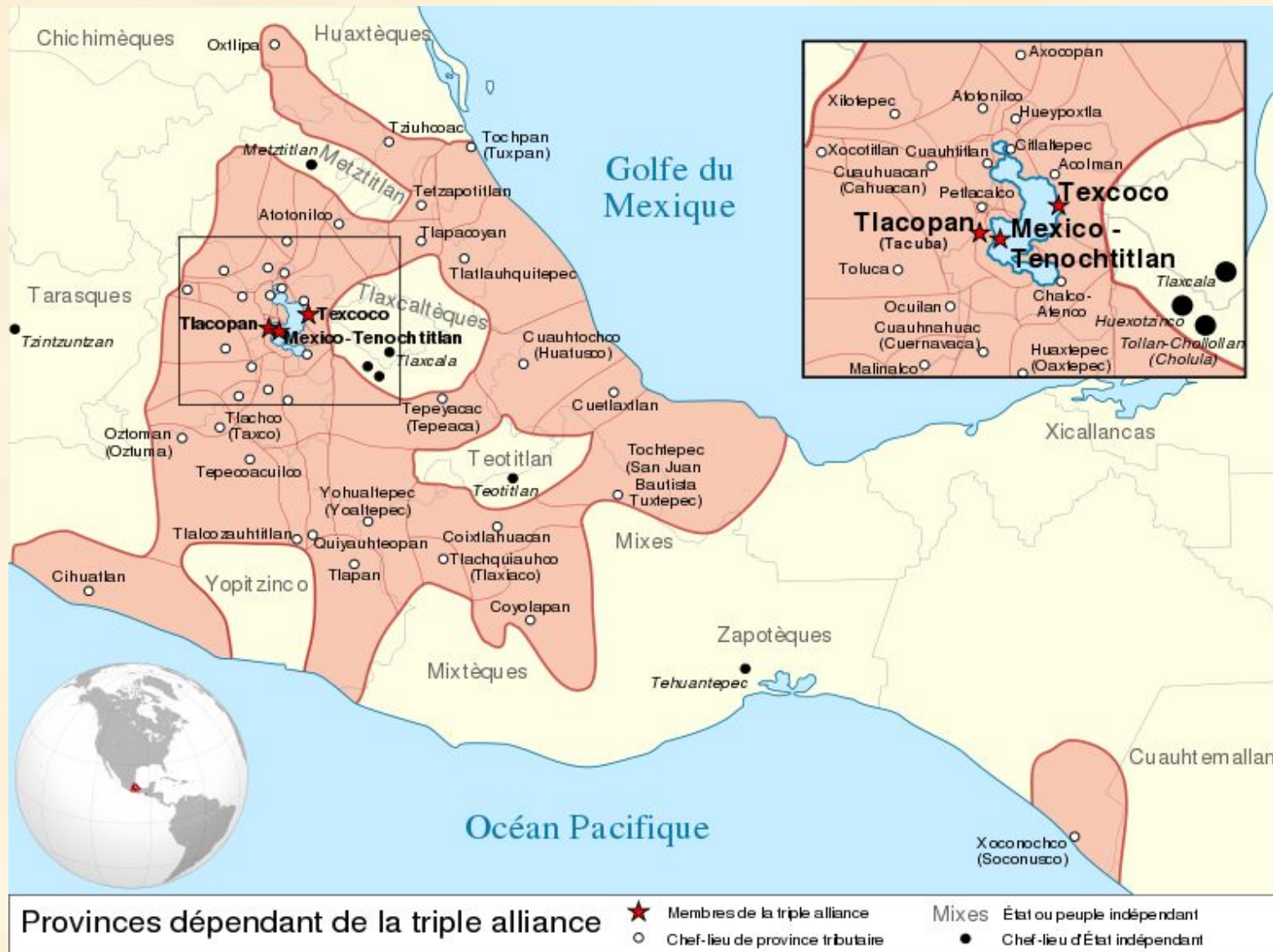
Территория, которую занимала цивилизация ацтеков