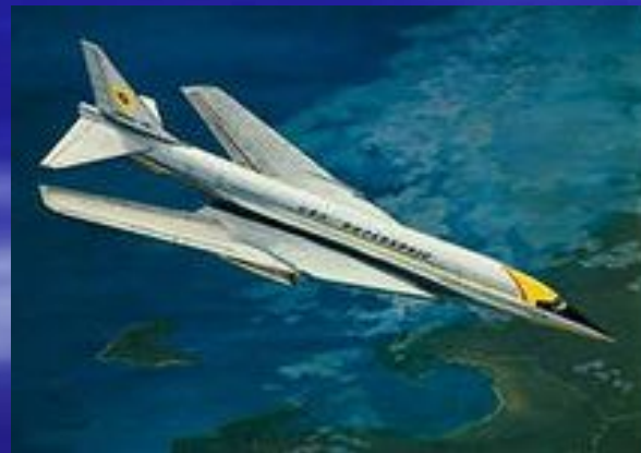
Boeing-733 Сверхзвуковой пассажирский самолет.