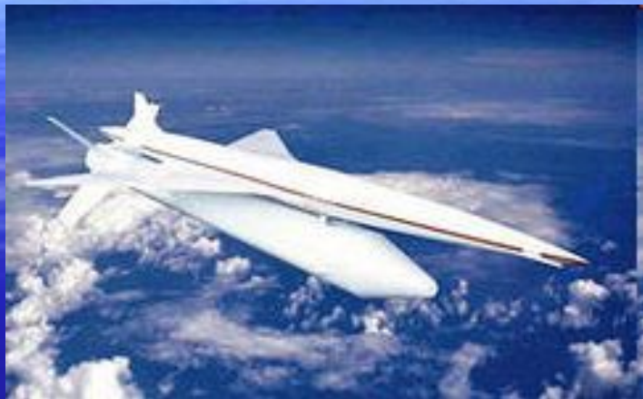
японского сверхзвукового самолета NEXST1.

переходить на реактивные самолеты. А в 1950-х годах началась эра сверхзвуковой авиации.