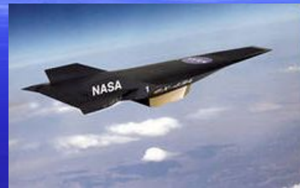
гиперзвуковой, наса, беспилотный, Самолёт, наса, x-43a