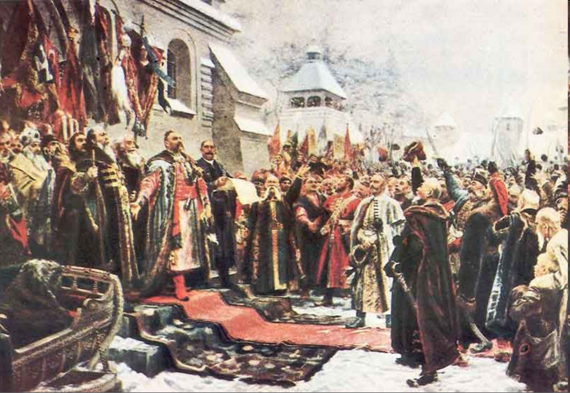
М. И. Хмелько Переяславская Рада