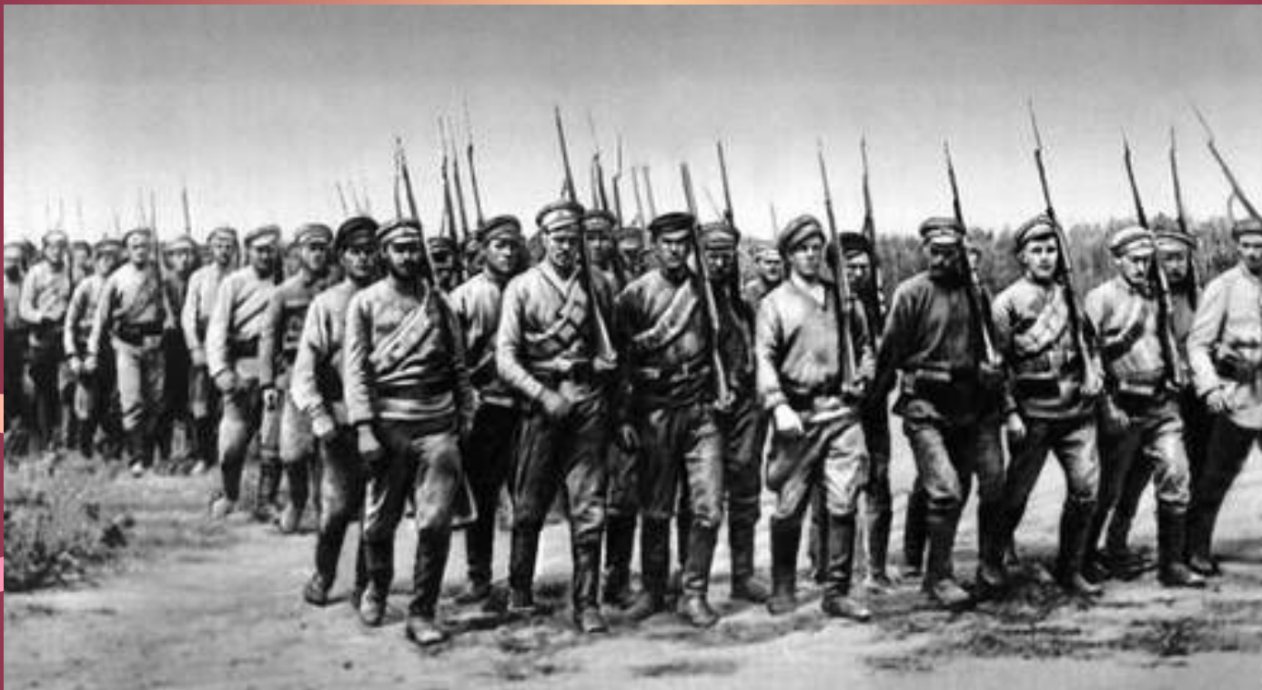
Один из первых полков Красной Армии