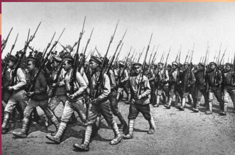
Парад частей Красной Армии