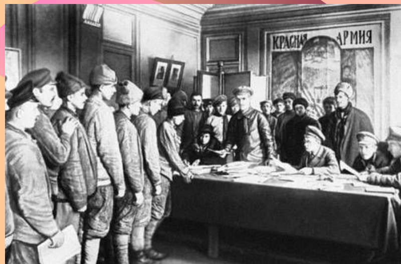
Запись добровольцев в Красную Армию