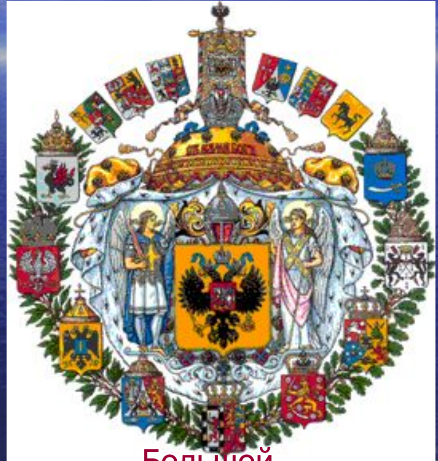
Большой Государственн ый герб 1882 года