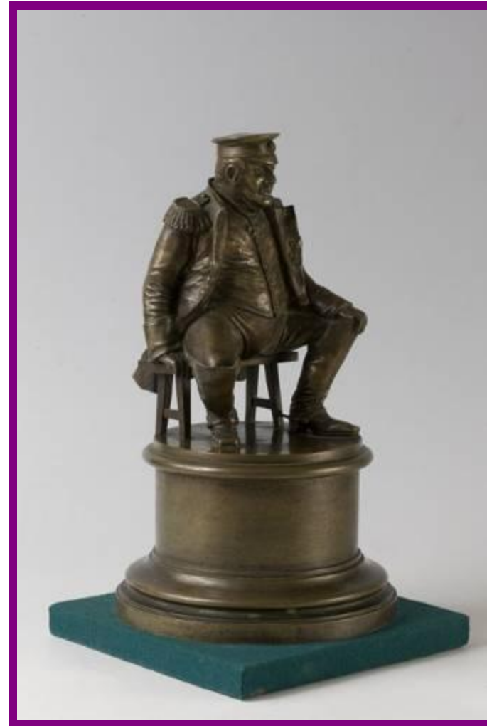
М. И. Кутузов.