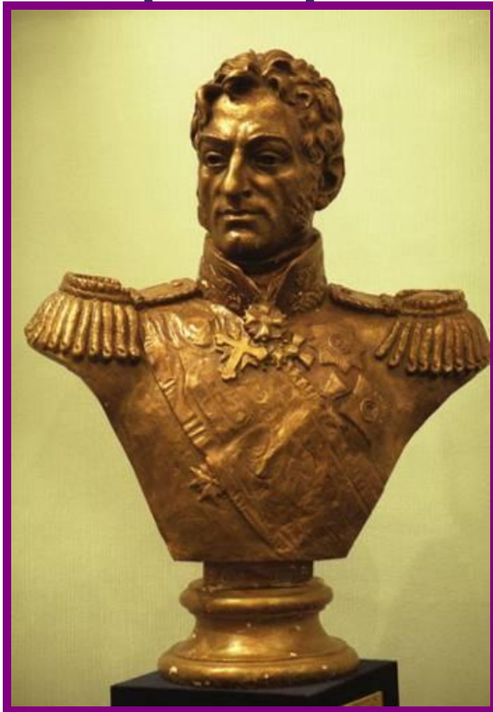
П. И. Багратион.