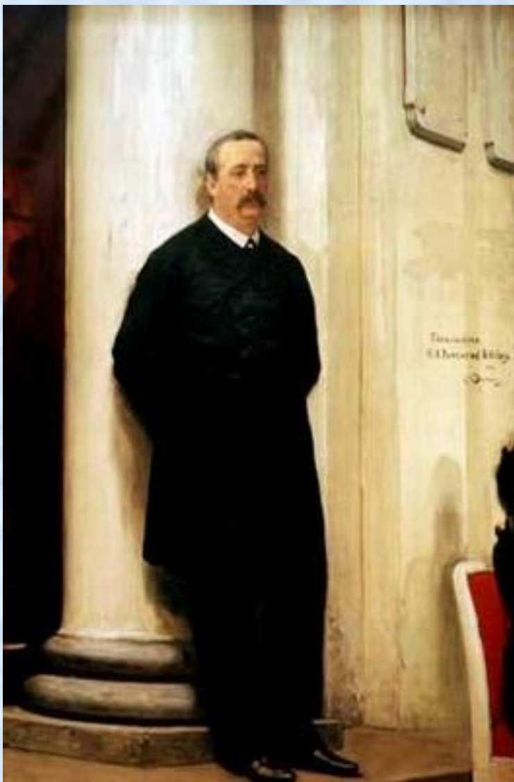
И.Е. Репин. Портрет А.П. Бородина.

Музыка была увлечением всей его жизни Бородина. Он - автор симфоний (среди них "Богатырская", "Русская"), инструментальных, вокальных и других сочинений.