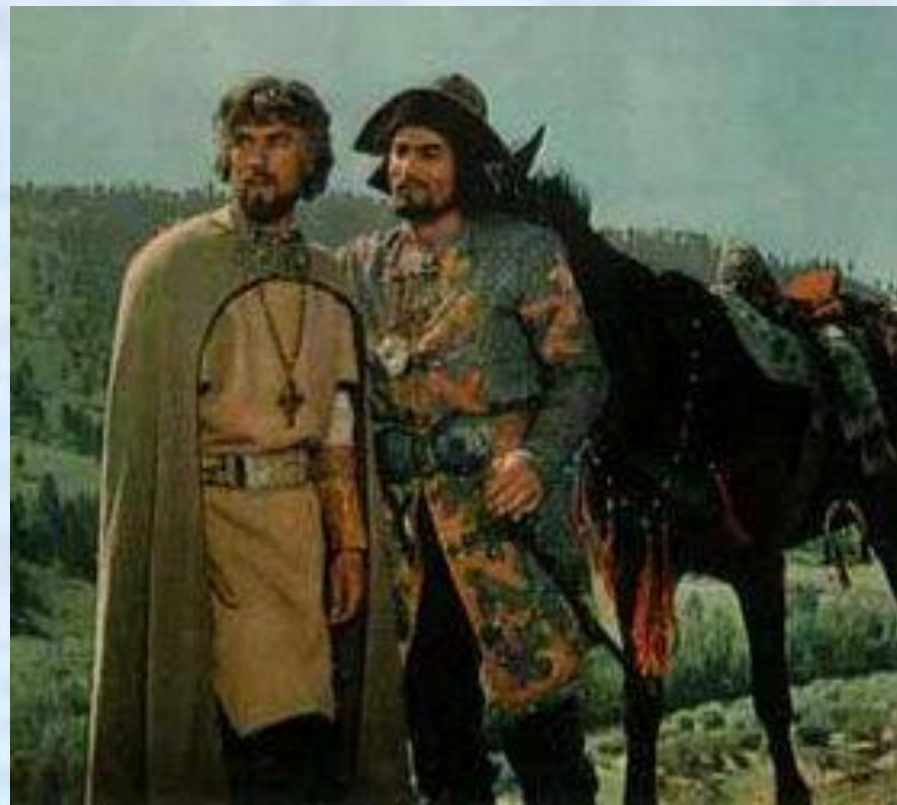
Кадр из фильма "Князь Игорь»

«Князь Игорь» — народно-эпическая опера. Сам композитор указывал на ее близость к глинкинскому «Руслану». Эпический склад «Игоря» проявляется в богатырских музыкальных образах, в масштабности форм, в неторопливом, как в былинах, течении действия.