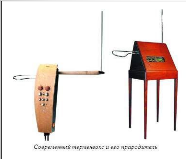
Современный терменвокс и его прародитель

В первых, классических моделях, созданных самим Львом Терменом, управление звуком происходит в результате свободного перемещения рук исполнителя в электромагнитном поле вблизи двух металлических антенн. Исполнитель играет стоя. Изменение высоты звука достигается путём приближения руки к правой антенне, в то время как громкость звука управляется за счёт приближения другой руки к левой антенне.