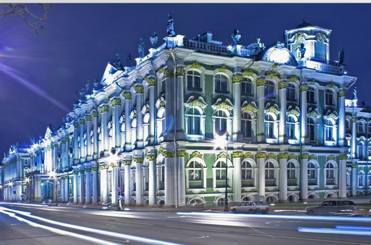
Зимний дворец. Санкт-Петербург. Растрелли.