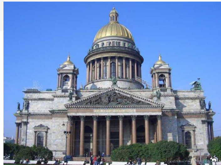
Исаакиевский собор. Санкт – Петербург. А. Монферран