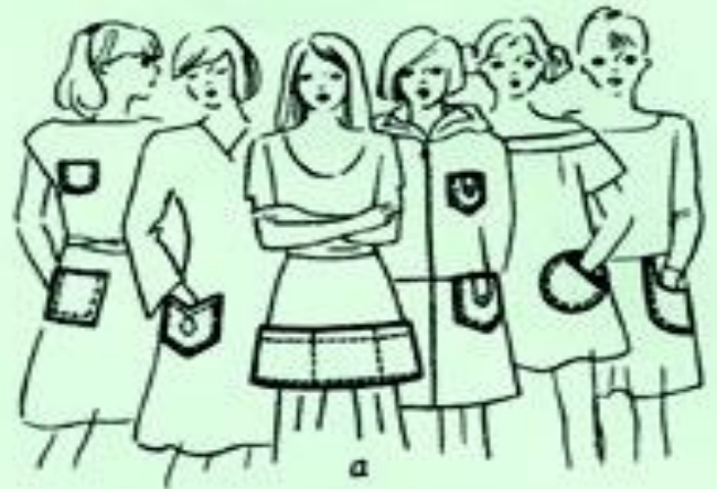
Разновидности накладных карманов