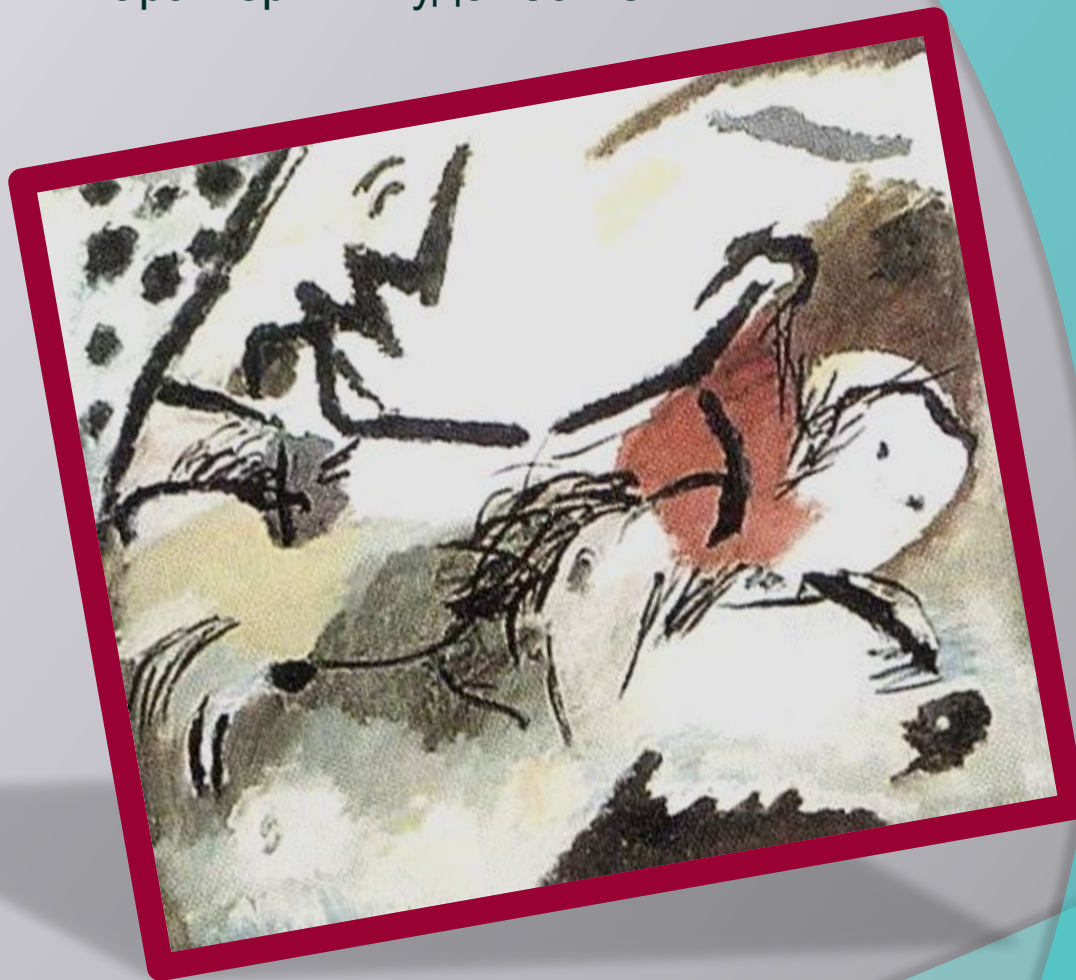
В. Кандинский «Композиция VI» 1913г.

Родоначальником этого течения стал русский художник Василий Кандинский