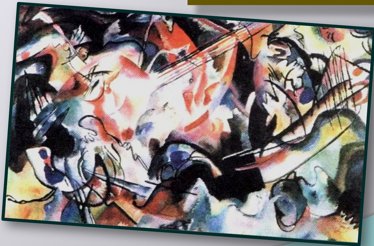
В.Кандинский «Композиция VI» 1913 г.

В абстрактных картинах не нужно искать привычные формы. Это просто эмоции в цвете.