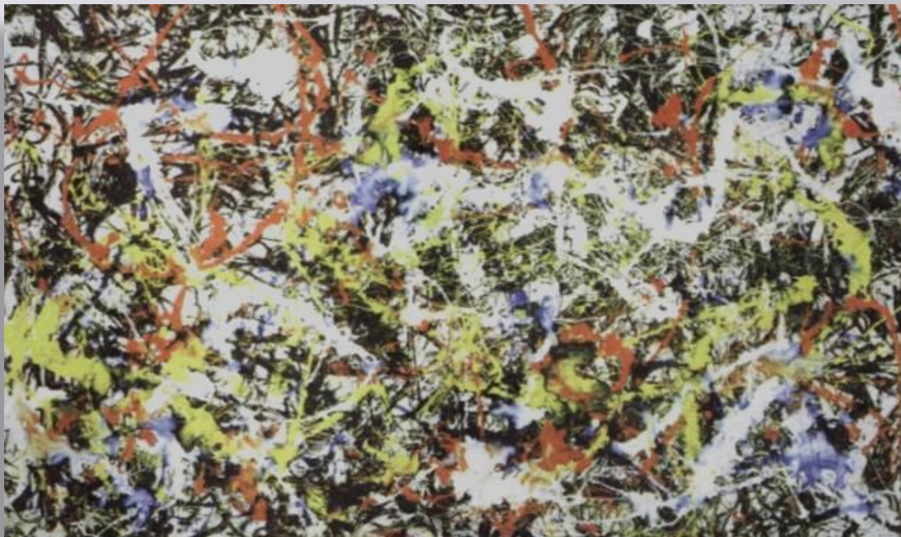
Дж. Поллок «№7» США

Но искусство живет и развивается. Потому что стремление к творчеству, желание взглянуть на мир по-своему - одно из главных качеств человеческой личности.