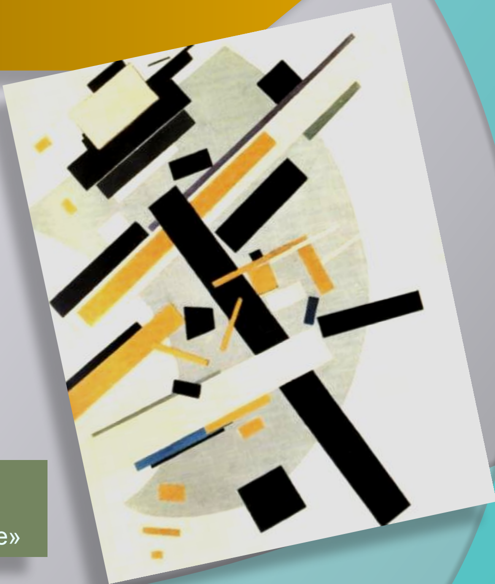
К. Малевич. «Супрематизм. Желтое и черное»

Супрематические композиции К. Малевича отвергали реальность, как таковую и создавали свой миропорядок.