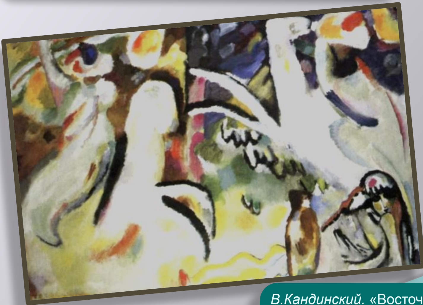
В.Кандинский. «Восточная сюита»

Абстрактные, или беспредметные композиции В.Кандинского - это музыка в красках.