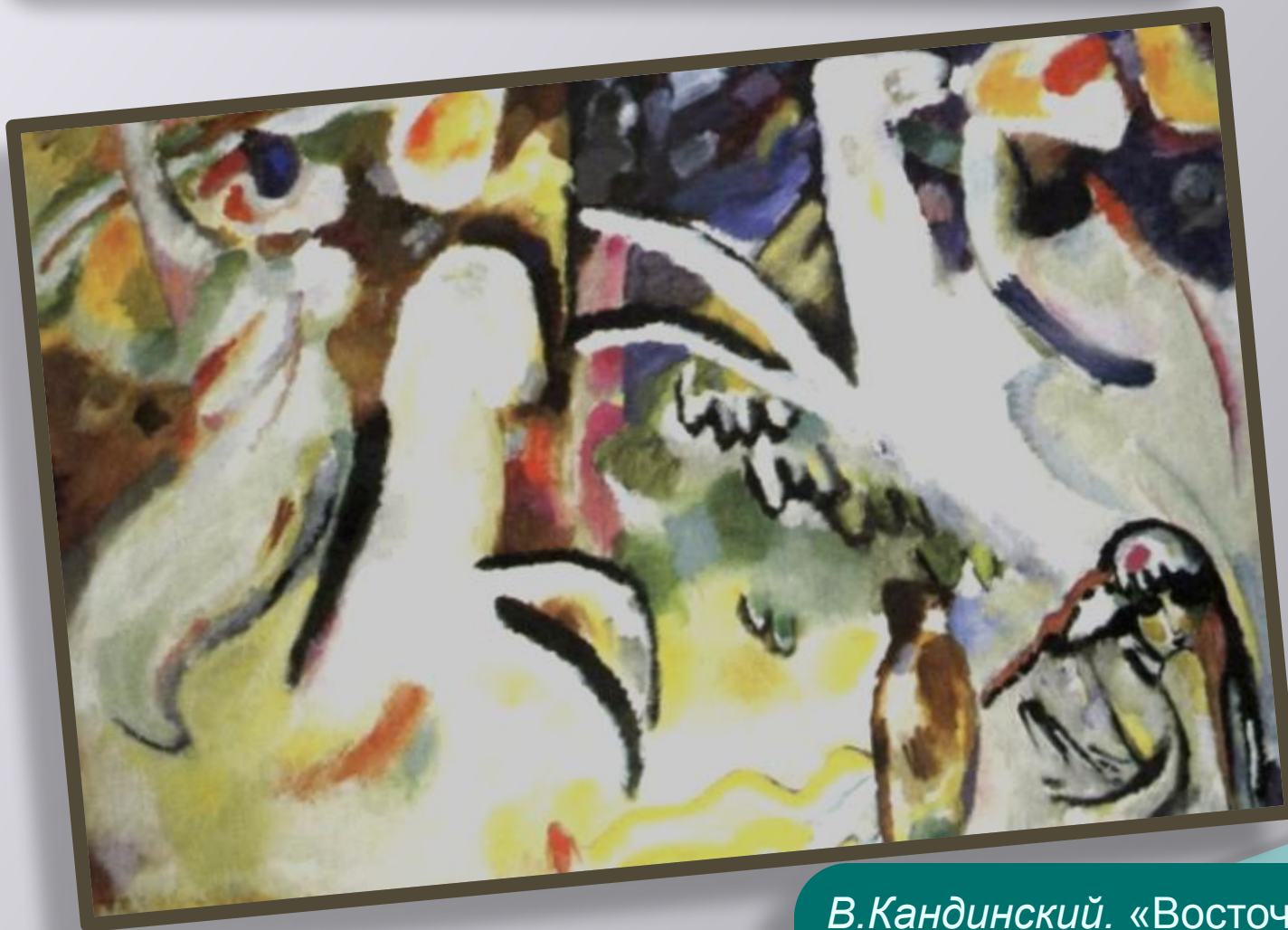
В.Кандинский. «Восточная сюита»

Абстрактные, или беспредметные композиции В.Кандинского - это музыка в красках.