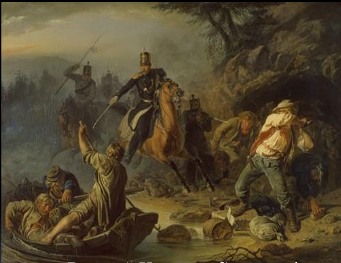
Василий Худяков «Стычка с финляндскими контрабандистами»