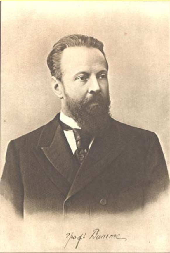
С.Ю. Витте, министр финансов.

В 1889 г. Витте назначен директором Департамента железнодорожных дел Министерства финансов, в феврале 1892 г. – управляющим Министерством путей сообщения, в августе 1892 г. – министром финансов. В 1-й половине 1880-х гг. Витте, будучи сторонником славянофильских взглядов, возражал против «обращения хотя бы части русского народа в несчастных рабов капитала машин».