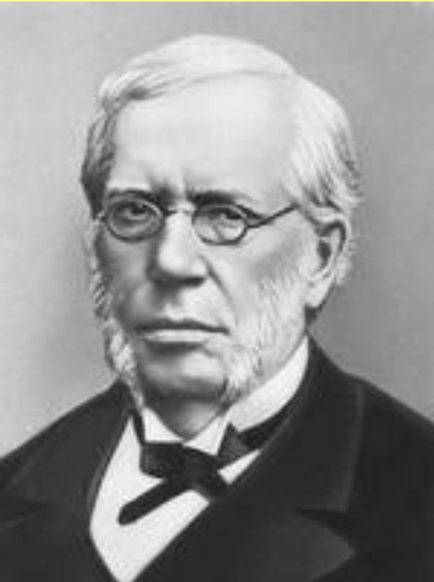
Вышнеградский Иван Алексеевич (1830–1895), министр финансов в 1886–1892 гг.

В остальном Вышнеградский продолжил политику Бунге. Повысились косвенные налоги и железнодорожные тарифы. Усилился протекционизм, особенно по отношению к тяжелой индустрии: ввозные пошлины на металл выросли в 10 раз, на машины – в 8,5 раза. Иностранные компании, встречая препятствия для экспорта товаров в Россию, начали развивать производство в самой России. Приток иностранных инвестиций способствовал подъему российской индустрии.