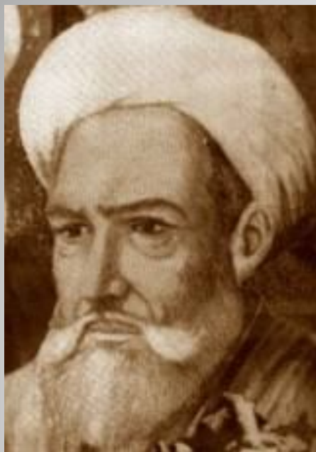
Хунайн ибн Исхак