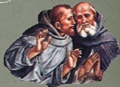
Гаунилон из Мармутье. «В защиту глупца».