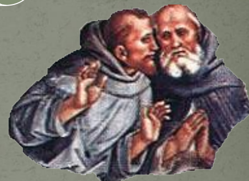
Гаунилон из Мармутье. «В защиту глупца».