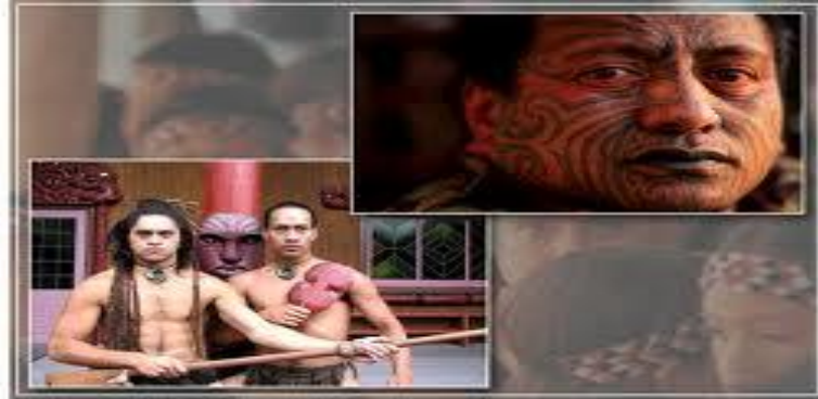
Маори - представители коренного населения Новой Зеландии.

Основное ядро – англоавстралийцы. Значительная доля иммиграции (даёт до 20 % прироста населения)